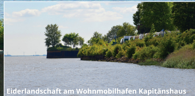
Eiderlandschaft am Wohnmobilhafen Kapitänshaus